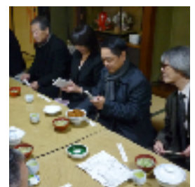
9. 今井屋さんで評判のカツ丼を