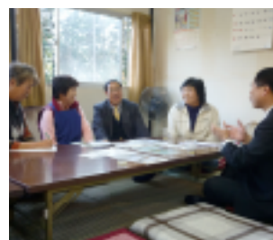
10. 農産物加工研究会の皆さんと