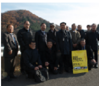
6. 視察の円良田湖にて