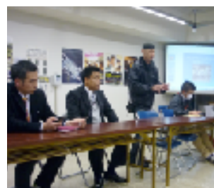
8. 商店街視察のあとの意見交換会