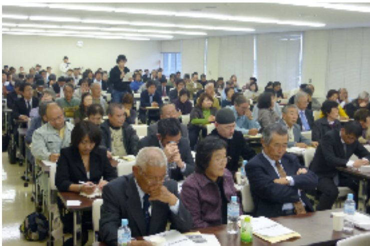
5. シンポジウムは定員オーバーになるほど盛況に