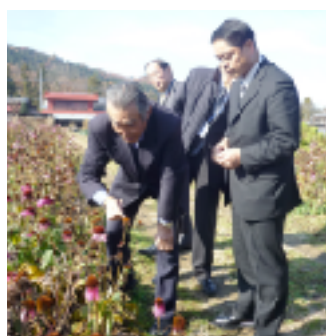
7. エキナセア畑にて